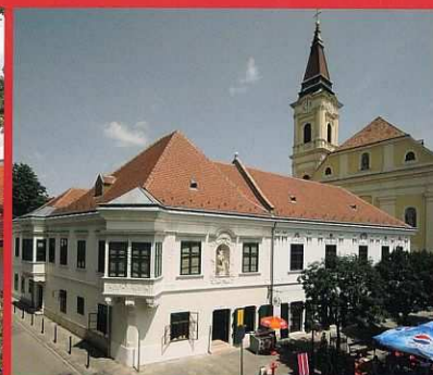
Székesfehérvár, Hiemer-Font-Caraffa épületegyüttes