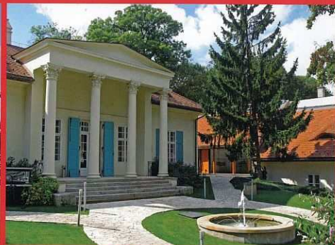
Budapest, Barabás villa