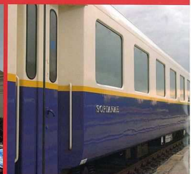
Budapest, MÁV Nosztalgia Kft., Élmenyvonat